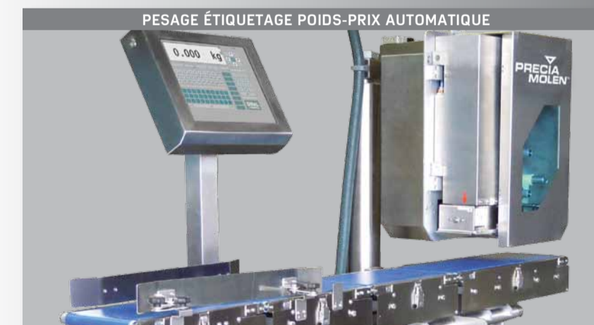
PESAGE ÉTIQUETAGE POIDS-PRIX AUTOMATIQUE