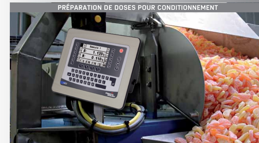
PRÉPARATION DE DOSES POUR CONDITIONNEMENT