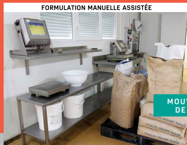
FORMULATION MANUELLE ASSISTÉE