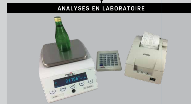
ANALYSES EN LABORATOIRE

PRECIA MOLEN propose une gamme complète de solutions dédiée à l'industrie agroalimentaire :