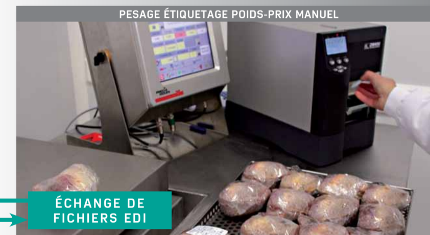
PESAGE ÉTIQUETAGE POIDS-PRIX MANUEL