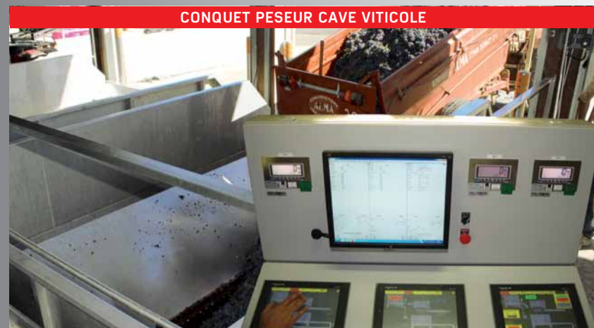
CONQUET PESEUR CAVE VITICOLE