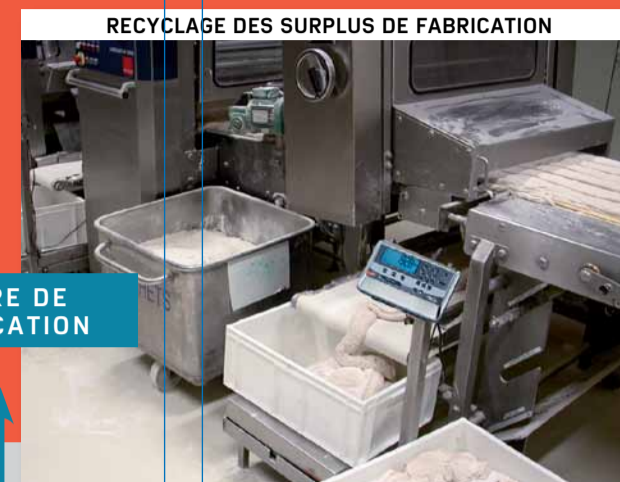
RECYCLAGE DES SURPLUS DE FABRICATION