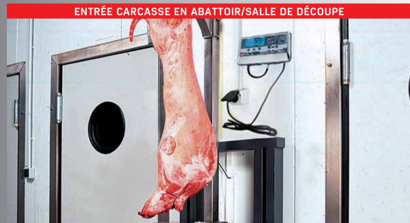
ENTRÉE CARCASSE EN ABATTOIR/SALLE DE DÉCOUPE