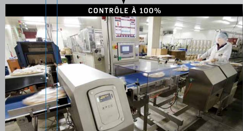
CONTRÔLE À 100%

SUIVI STATISTIQUE RÉGLEMENTAIRE ET QUALITÉ