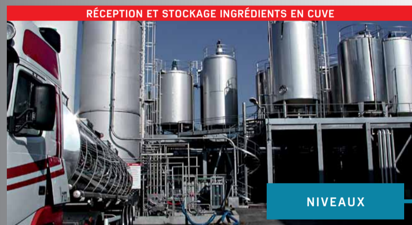
RÉCEPTION ET STOCKAGE INGRÉDIENTS EN CUVE