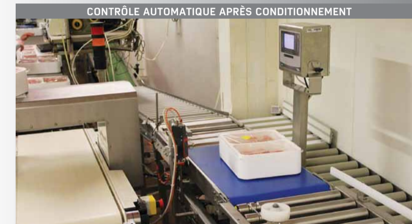
CONTRÔLE AUTOMATIQUE APRÈS CONDITIONNEMENT